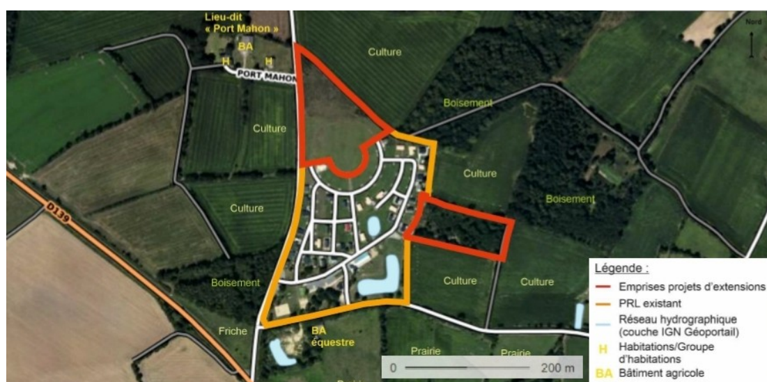
Projet d'extension du PRL (source dossier)

Le projet est constitué de deux extensions au parc. La première est prévue vers le nord, sur un terrain d'assiette de 1,6 ha. L'emprise du projet y a été réduite à 0,9 ha du fait de la présence d'une zone humide en partie nord. La deuxième extension se situe à l'est sur une surface de 0,9 ha. Elle a également été réduite afin de tenir compte de la végétation déjà en place. Au total, une trentaine de lots pourront être aménagés.