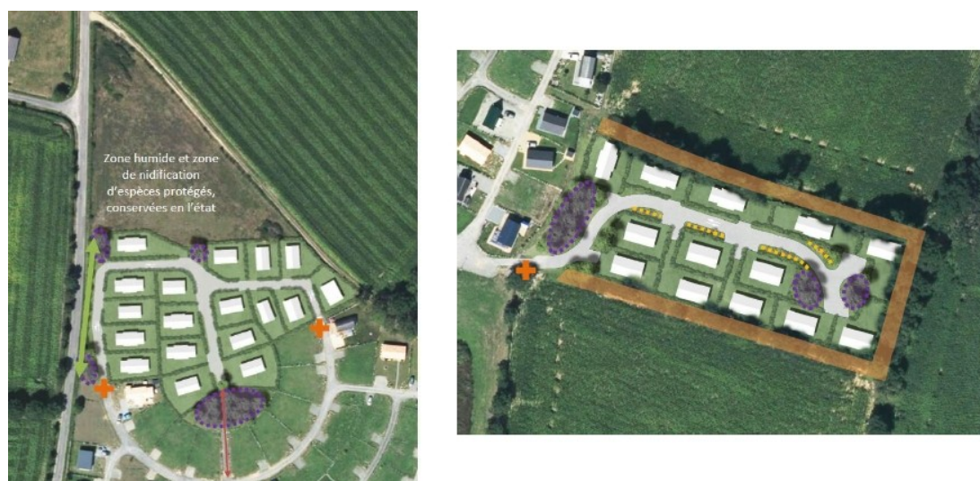
Gros plan sur l'aménagement des extensions, faisant apparaître la préservation des zones humides et de la végétation en place (en orange)